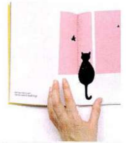
ILUSTRAÇÃO NOVO LIVRO

Life With a Cat ( Vida de Gato , em português), da ilustradora Sara Felgueiras, é um livro de 40 páginas, escrito em inglês, com 14,8x21cm, que conta as peripécias da vivência com um gato. Disponível na Apaixonarte ( em.apaixonarte.com ).